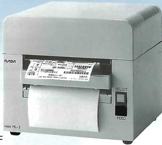
HL-3F (ラベル剥離機構付)

熱転写方式を採用。内部にはANK 160文字を内蔵し、JIS第一水準・第二水準の漢字、JIS 160文字の英数、カタカナ、記号 及び図形の印字、バーコード、二次元コード、ユーザの作成シンボル、マーク等がラベル及びそれに相当するものに印字ができるパソコン対応のラベルプリンタです。