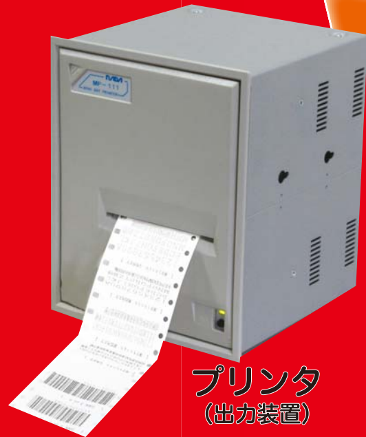
プリンタ (出力装置)