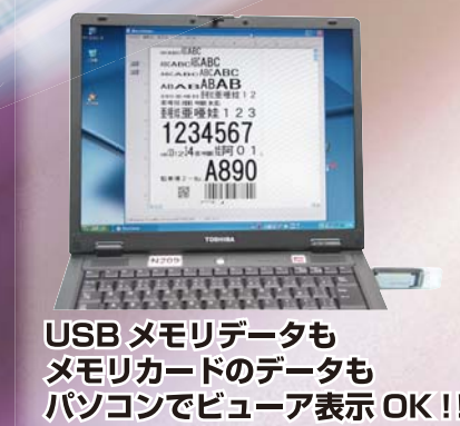
USBメモリデータも メモ리카ードのデータも パソコンでビューア表示OK!!